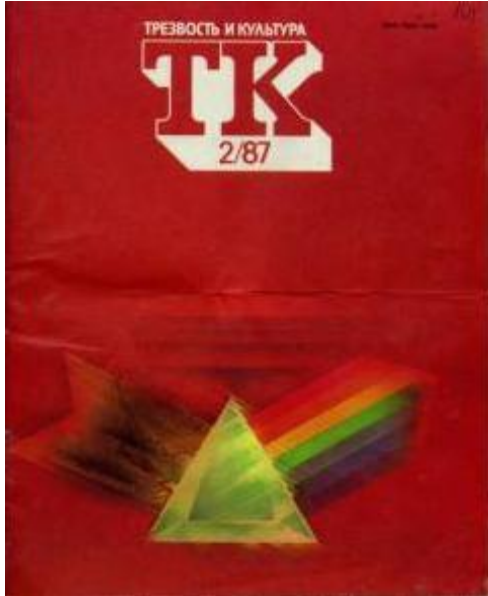
Уникальный по эффективности выпуск журнала «ТРЕЗВОСТЬ И КУЛЬТУРА» 1