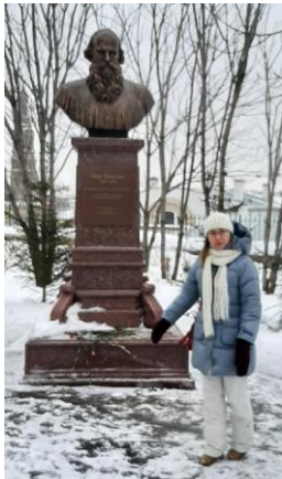
Наследники Толстого по прямой