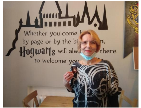
Победительница конкурса акротекстов

27 января состоялась прогулка и торжественное чае- и кофе-питие в известном кафе «9 3/4». Мнатовцы и их добрые друзья открыли для себя много новых мест в Казани, связанных с трезвостью. Большой интерес вызвали фотографии по истории трезвеннического движения с мая 1987 года до наших дней. Конкурс акротекстов пополнил копилку методических материалов для будущих уличных профилактических акций. Некоторые из них вы видите ниже. Автор лучшего акротекста награжден значком «Гарри Поттер» (ручной работы!).