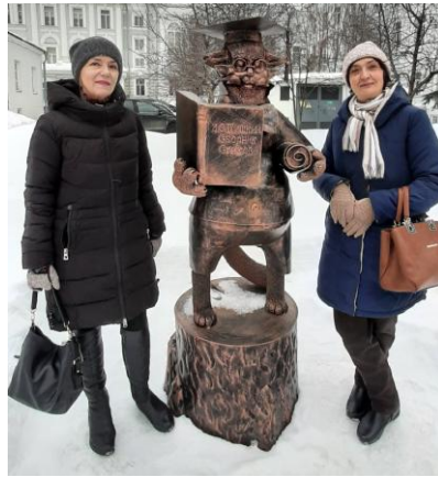
Пушкин с нами!